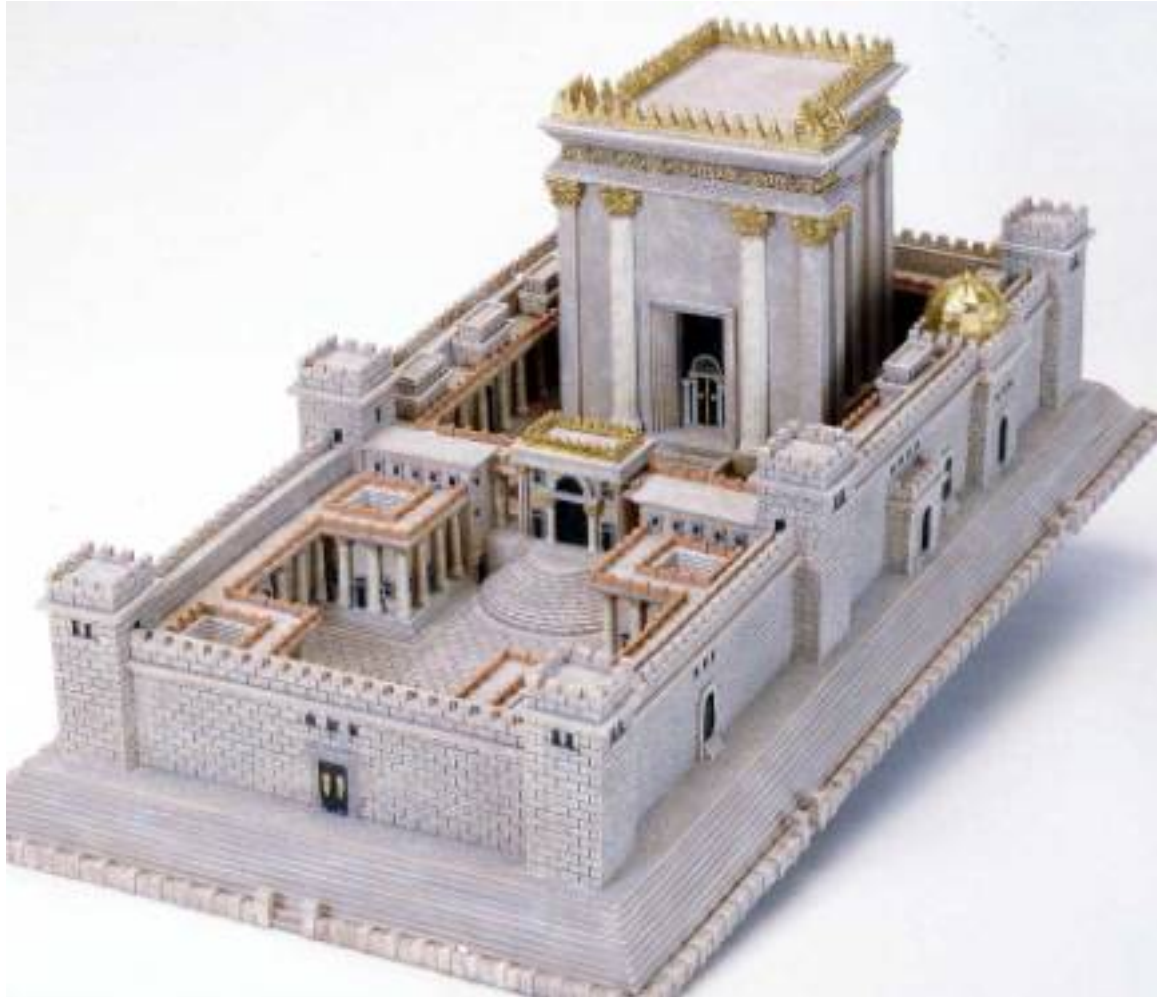
UN MODELLO DEL TEMPIO DI ERODE